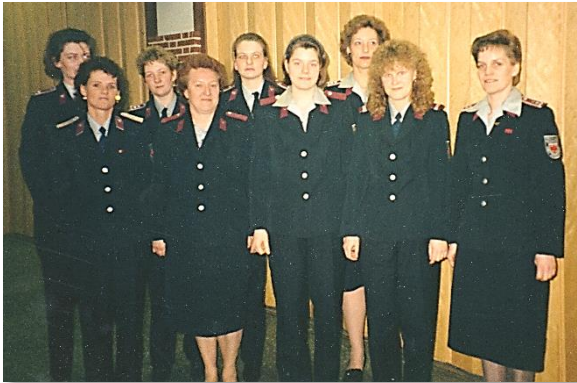
Frauengruppe, davon 2 aktive Einsatzkräfte

11.06. bis 13.06.1993: Jubiläum 110 Jahre FF Tangermünde