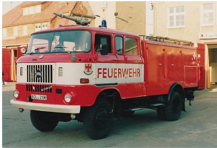
TLF 16 W50 Baujahr 1974