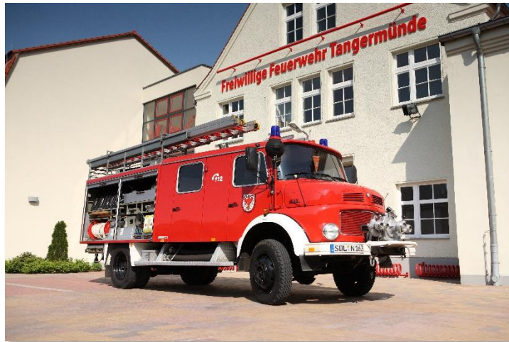
LF 16-TS Baujahr 1990