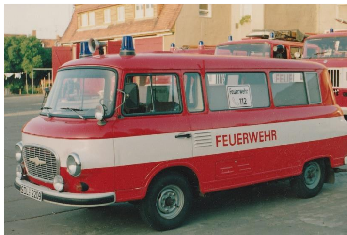
VRW B1000 Baujahr 1989