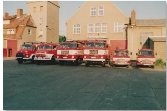
Fuhrpark v.l.n.r. LF 16-TS, TLF 16/24, LF 16 W50, TLF 16 W50, VRW B1000, ELW B1000 Es fehlt der MTW LO.