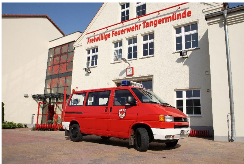
ELW 1 Baujahr 1992