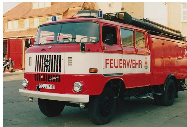
LF 16 W50 Baujahr 1982