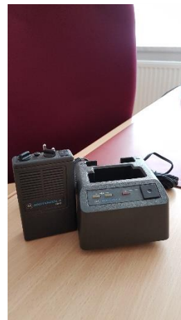
Alarmierungsart: Analog, Hersteller: Motorola, Serie: BMD

15.09.1991: Erhalt des TLF 16/24 (von unserer Partnerwehr Lich)