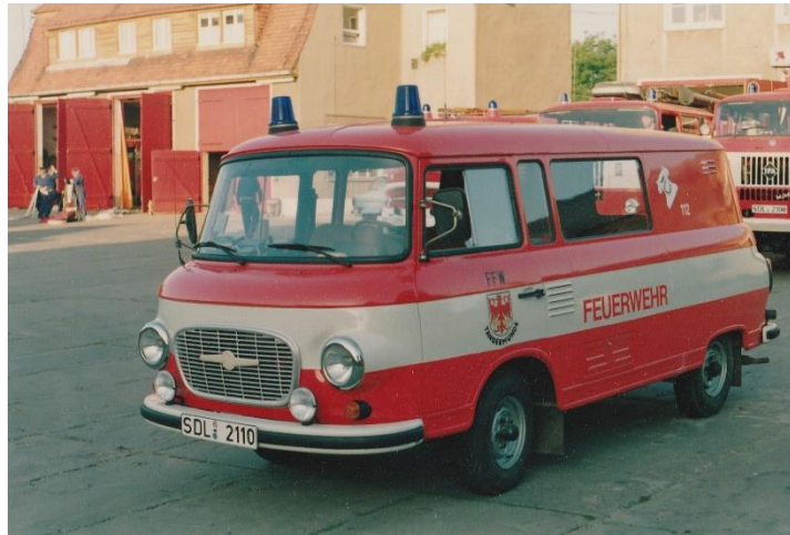
ELW B1000 Baujahr 1976

Eine Vereinbarung zur gemeinsamen Ausbildung und gegenseitigen Unterstützung besteht seit dem 10.01.1991, zwischen der FFW Tangermünde und der WFW der Dekor-Span Tangermünde.