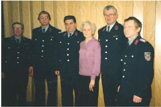
Alters- und Ehrenabteilung