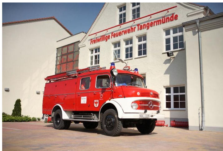
TLF 16/24 Baujahr 1966