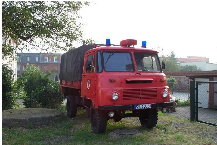
MTW LO Baujahr 1978